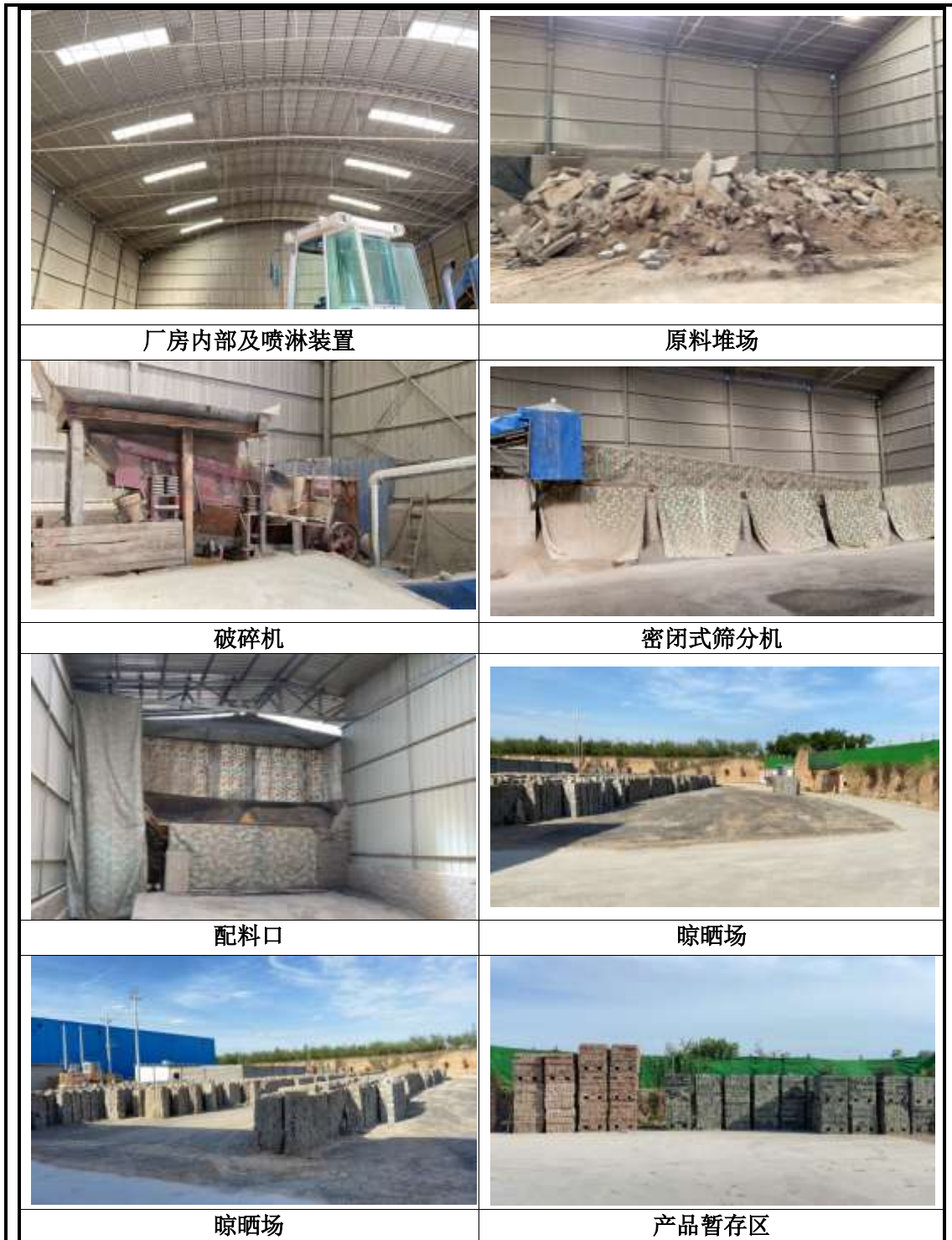
图 2-1 项目实际建设情况