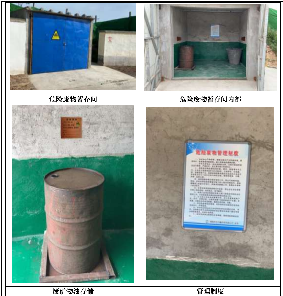
图 3-1 各项环保设施实际建设和运行情况